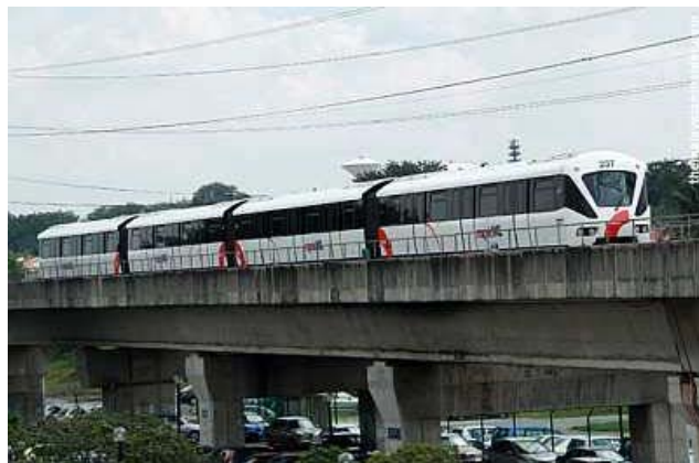
Akses kepada stesen-stesen MRT tetap berkurangan, menurut Awer. — gambar fail

KUALA LUMPUR, 13 Feb — Projek Aliran Transit Massa (MRT) Lembah Klang yang akan menelan RM36.6 bilion didakwa dibangunkan menggunakan data pengangkutan lapuk dan boleh menyebabkan peningkatan kos tambahan RM403.5 juta dari segi perbelanjaan bahan api dalam tempoh lima tahun pertama ia operasi.