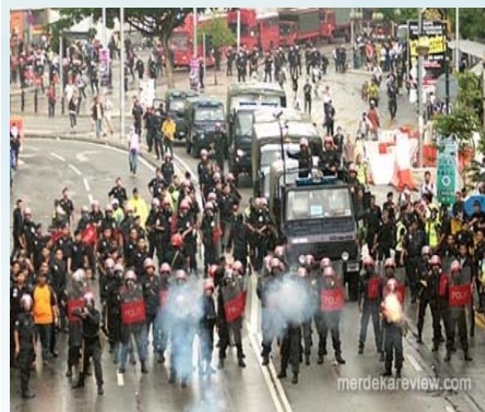
709 Bersih 2