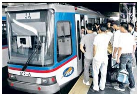
Penggunaan MRT dapat mengurangkan peratus perlepasan bahan buangan daripada kenderaan yang mencemarkan alam sekitar. - Gambar hiasan

Pengurangan pelepasan bahan pencemar daripada kenderaan sebanyak 30 peratus di Toronto dijangka dapat menyelamatkan 189 nyawa dan menjimatkan 900 juta Dolar Kanada dari segi penjimatan kebajikan kesihatan.